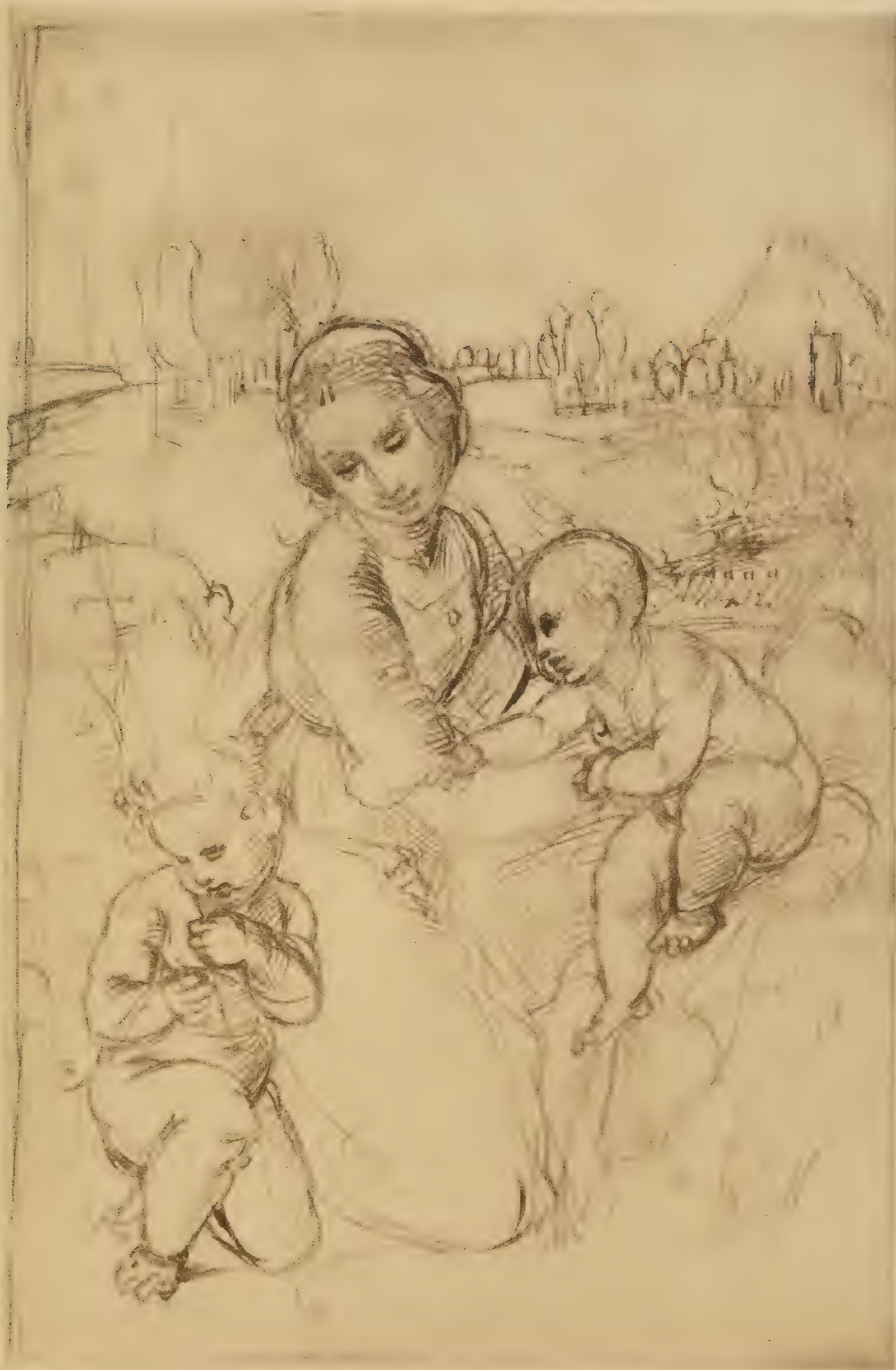
Dessin pour la Vierge Esterhazy à Budapest